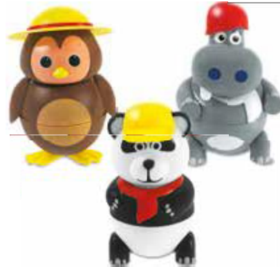
Panda, Hippo und Birdy Speiseeis mit Vanille, Erdbeer und Schokolade CHF 6.50