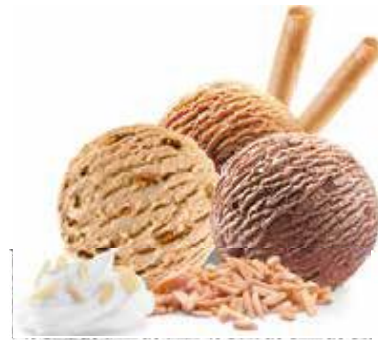
Coupe Shanaya Haselnuss-, Chocolat- und Café- Rahmglace mit Mandel-Splittern und Rahm CHF 10.50