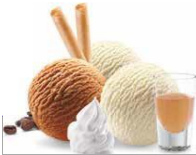
Coupe Baileys Vanille- und Café-Rahmglace mit Baileys und Rahm CHF 10.50