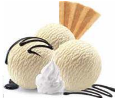
Coupe Danmark Vanille-Rahmglace mit Choco-Sauce und Rahm CHF 10.50 / mini CHF 8.50