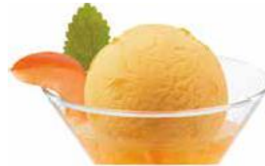
Sorbet Abricot Aprikosen-Sorbet mit Prosecco