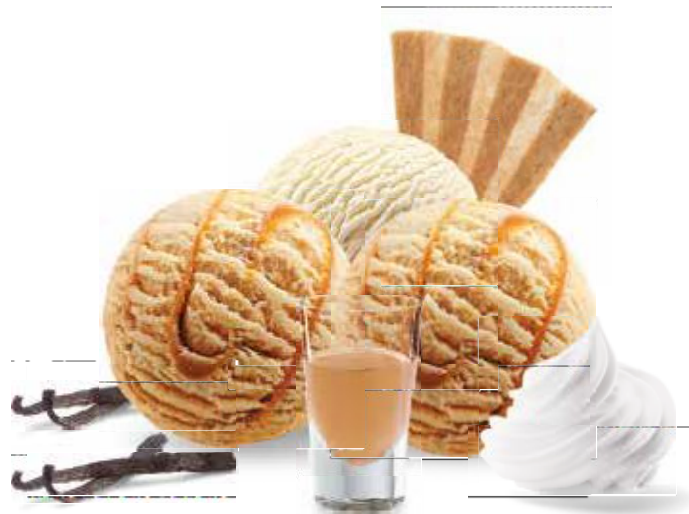
Coupe Ireland Irish Cream- und Vanille-Rahmglace mit Baileys und Rahm CHF 10.50 / mini CHF 8.50