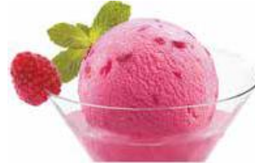
Sorbet Framboise Himbeer-Sorbet mit Himbeergeist CHF 10.50 / mini CHF 7.50