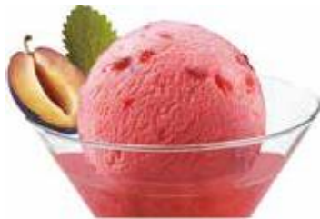
Sorbet Prunes Zwetschgen-Sorbet mit Vieille Prune CHF 10.50 / mini CHF 7.50