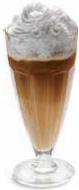
Ice Café Café-Rahmglace mit Rahm CHF 10.50