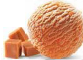
Caramel Feinstes Rahmglace kombiniert mit verführerischen Rahm-Caramel-Stücken