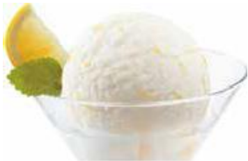
Sorbet Citron Zitronen-Sorbet mit Wodka