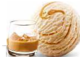
Irish Cream Die verführerische Süsse von Irish Cream in perfekter Harmonie mit zartschmelzender Rahmglace