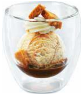
Irish butter coffee Eine Kugel Irish Cream-Rahmglace, kombiniert mit frischem Espresso, Sablés und Rahm CHF 6.50