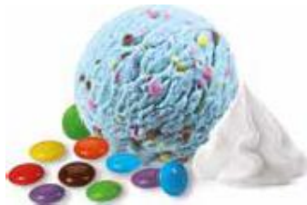
Coupe Smarties Konfetti-Rahmglace mit Smarties und Rahm CHF 4.50