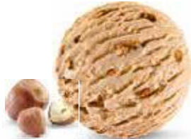
Haselnuss Feinste Haselnuss-Rahmglace mit knusprigem Haselnusskrokant