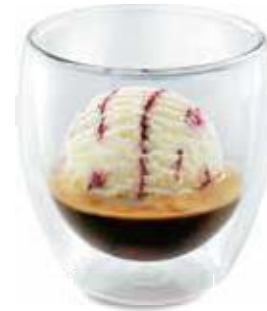
Coretto Grappa Eine Kugel Grappa-Rahmglace übergossen mit einem Espresso CHF 6.50