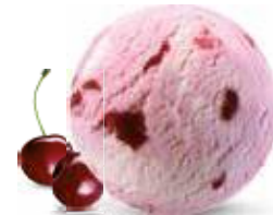
Amarena Cremige Rahmglace mit typischen Amarena-Sauerkirschen