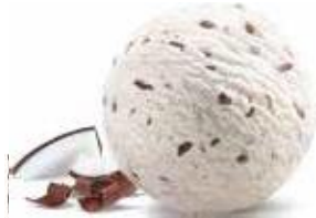
Kokos & Chocolate Chips Cremige Kokosmilch-Glace verfeinert mit feinsten Kokos-Raspeln und knackigen Schokolade-Stücken Laktosefrei & Vegan